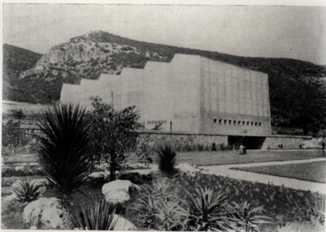
יד למגינים — לזכר הנופלים

בי"ט טבת תש"ז התקיימה פעולת התגמול נגד המעורבים ברצח היהודים בבתי הזיקוק. היו אלה ברובם תושבי בלדא־שייך. במבצע זה השתתפו אנשי הפלמ"ח, החי"ש של הסביבה ובתוכם חברי יגור. הפעולה בוצעה על פי הוראות המוסדות. בלילה זה נפלו חנן זלינגר שהיה מפקד החי"ש וחיים בן־דור. היה חשש שהאנגלים יגרמו לנו צרות באם יודע להם