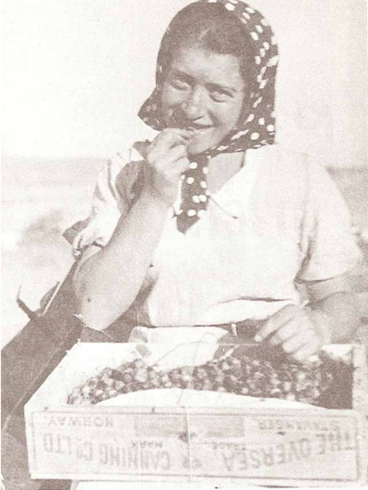
תמונתה של צפורה ורדי כפי שצולמה ע"י ערי גלס והתפרסמה בשנות השלושים.