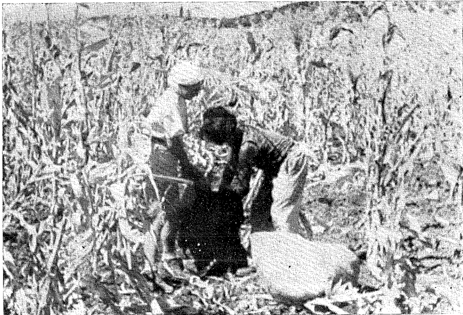
בימים מקדם: בקט"ף התירס